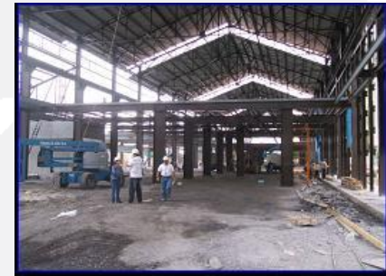
Nave Lewis, Foro de 250 ton Las Culturas