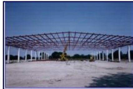
Estructura De Alma Abierta