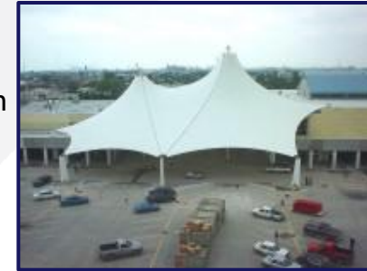
Lona HEB Gonzalitos

CLIENTE: Luz eterna S.A. De C.V. 9,300m 2 260 ton PROYECTO: Diseño, fabricación y montaje de estructura de acero y lamina Para planta santa Catarina. Fases 1, 2 y 3.