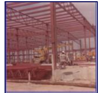
Soriana San Pedro