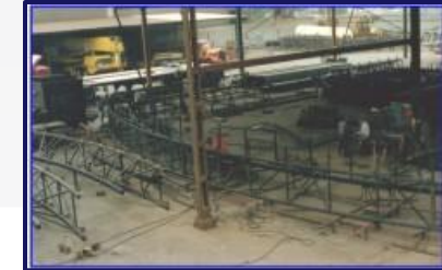
Arco Planta Nemark