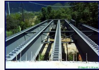
Puente Vehicular Los Cristales